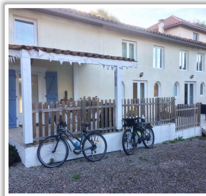
Cyclistes de tourisme en direction du Portugal

Nous avons eu une bonne année 2021 malgré les difficultés évidentes avec les voyages. Nous avons rencontré beaucoup d'invités charmants de toute la France et même du monde. Depuis notre ouverture, nous avons eu des invités du Royaume-Uni, de Belgique, de Suisse, d'Allemagne, du Portugal, de Croatie, d'Espagne, de Hollande et même du Brésil et du Sénégal!